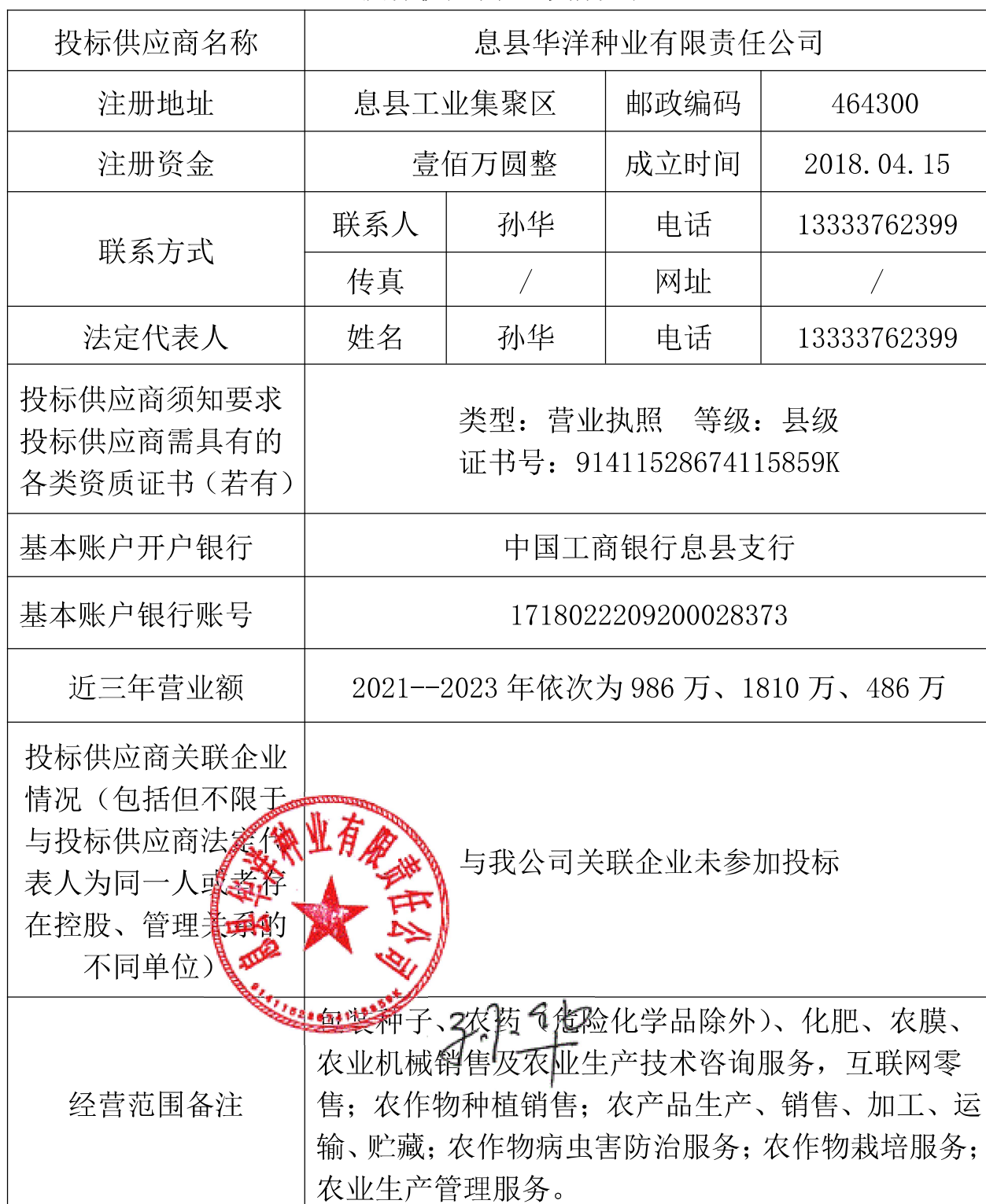
投标供应商基本情况表